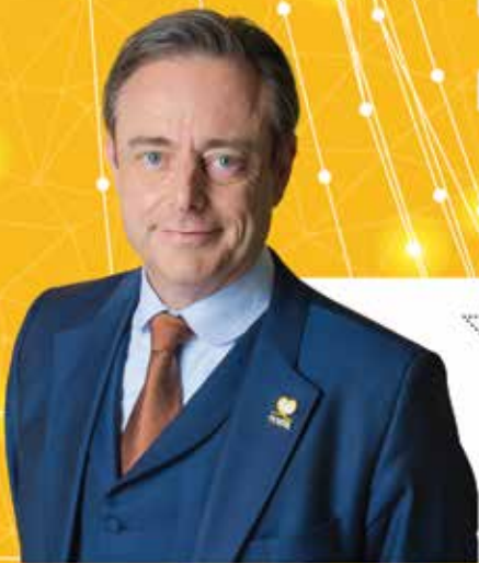
Bart De Wever Algemeen voorzitter

Engie passeert tweemaal langs de kassa. Door het uitstelgedrag van paars-groen kan het energiebedrijf extra veel geld vragen om de kerncentrales te verlengen. En daarbovenop ontvangt Engie van de regering ook nog eens gassubsidies. De belastingbetaler betaalt het gelag.