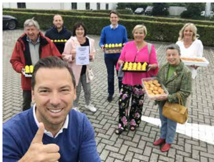
▲ Enkele bestuursleden verrasten het gemeentepersoneel met cupcakes.