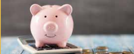
Vlaamse steun voor 't Groenhof en Hooidonk (p. 2)