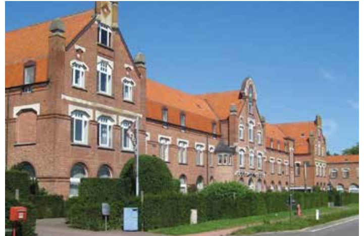
▲ Zorgverblijf Hooidonk krijgt een stevig duwtje in de rug.

"Het doet me deugd om te zien hoe onze toeristische ondernemers zelfs in moeilijke omstandigheden inspanningen leveren om vakantie mogelijk te maken voor kwetsbare mensen", zegt minister Demir. "Zij verdienen niet alleen een dikke pluim, maar ook de nodige middelen om de rekening te laten kloppen. Daarom konden onze zorg- en jeugdverblijven en vakantieorganisaties ook voor de periode tussen 8 juni en eind augustus op onze steun rekenen. Er volgde ook nog een tweede projectoproep #ontdekkingtroef en de vele partners van het netwerk 'Iedereen verdient Vakantie' kunnen rekenen op nog meer middelen om vakanties voor kwetsbare groepen mogelijk te maken."