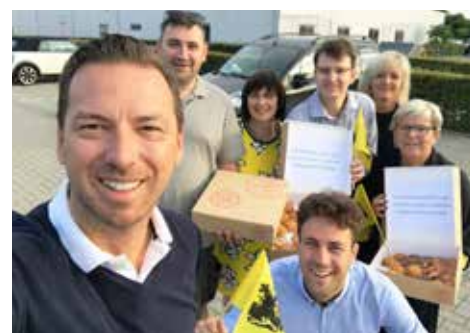
▲ N-VA Zandhoven verraste de medewerkers van de technische dienst en het gemeentehuis met zoetigheden.