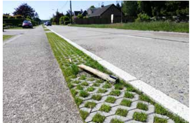
▲ De houten paaltjes die het fietspad van de rijbaan moeten afscheiden worden voortdurend stukgereden.

“Dat de paaltjes te pas en te onpas worden stukgereden,