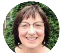
Conny Van den Heuvel

"De komende periode gebruiken we om verder te overleggen met de betrokken lokale besturen en actoren. De bal ligt evenwel in het kamp van de industrie. Ja, een leidingstraat kan een meerwaarde zijn voor onze economie en voor de energie- en klimaattransitie. Maar neen, te grote impact op ons leefmilieu en onze mensen aanvaarden we niet", aldus minister Demir.